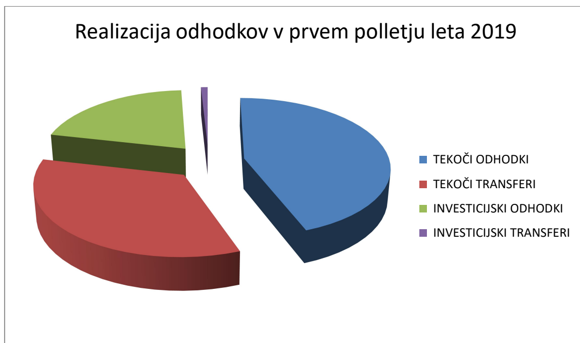
Grafikon št. 2: Struktura realiziranih odhodkov v Občini Jezersko v obdobju januar-junij 2019

Bilanca prihodkov in odhodkov ob polletju izkazuje presežek v višini 122.344,40 €.